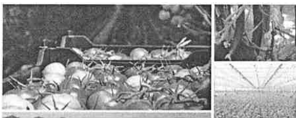
Filière fruits et légumes de serre du Québec