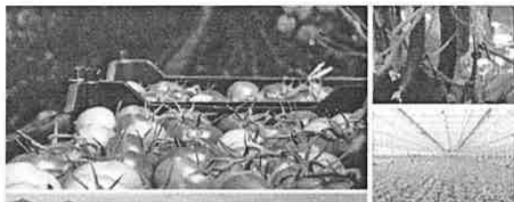
Filière fruits et légumes de serre du Québec