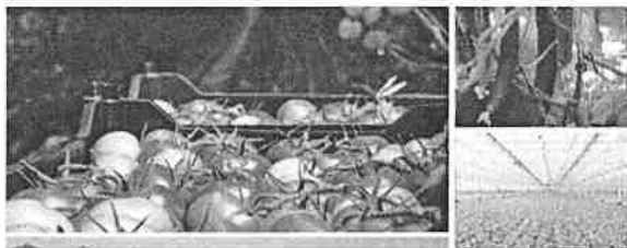
Filière fruits et légumes de serre du Québec